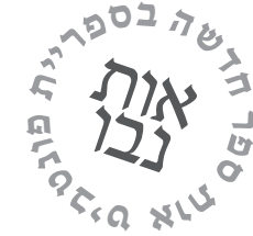
טקסט במשקל רגיל 10.5 פוינט

אות היא סמל גרפי אשר מתפתח ומתגבש במרוצת הדורות. מצוירים פיגורטיבים, מורכבים לביצוע, עוברת האות במשך השנים, תהליך הפשטה מרתק לכשעצמו. האות כסימבול מהווה את היחידה הקטנה והבסיסית ביותר בטיפוגרפיה ויחסי הגומלין, בינה לבין דפוס המערך הטיפוגרפי כולו, באים לידי ביטוי ברמות שונות ומגוונות. בזמן שכל הרבדים מתפקדים יחד בהרמוניה, כל אחת מהאותיות נושאת בתוכה את המטען הגנטי של המערך בשלמותו. דבר שמתקיים באופן טבעי בכתב יד משום שכותב האותיות טוען בכל אחת מהן את מאפייני האישיות שלו וכך נוצרת הרמוניה אורגנית, שעליה מבוסס גם עיקרון הגרפולוגיה. נובע מכך שגם באות הדפוס קיימת חשיבות לנתיב הזרימה של כלי הכתיבה, משום שכלל שהעין הקוראת תמצא את דרכה