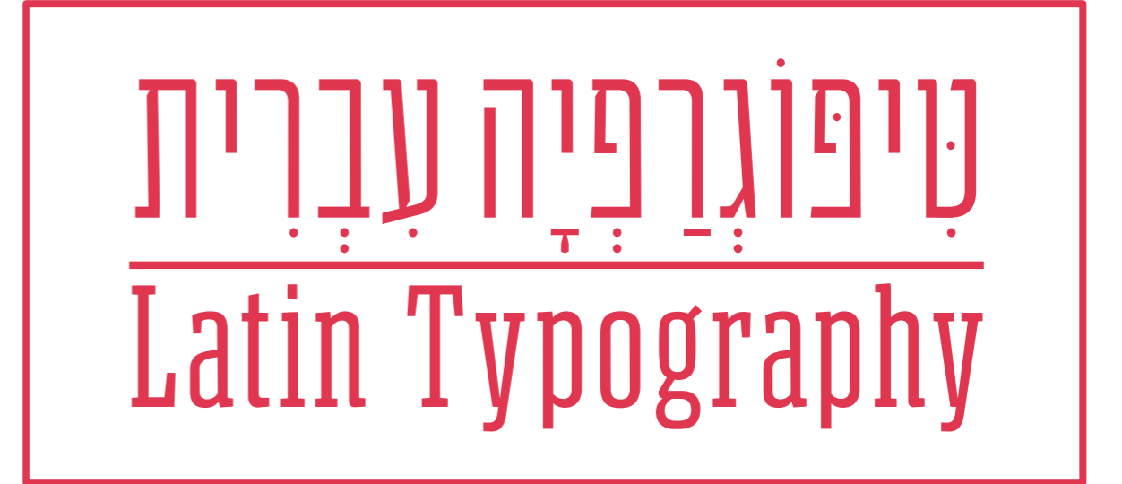
Matador Narrow Black

A B C D E F G H I J K L M N O P Q R S T U V W X Y Z a b c d e f g h i j k l m n o p q r s t u v w x y z