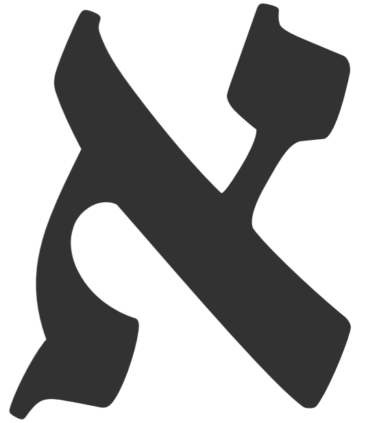
טואירן במשקל רגיל (מורחב)

א בגד הו ז ח ט י כך למסנן סע פף צץ קר שת אדנה ללכ רסת אע 0123456789 { } [ ] ; ? ! * % $